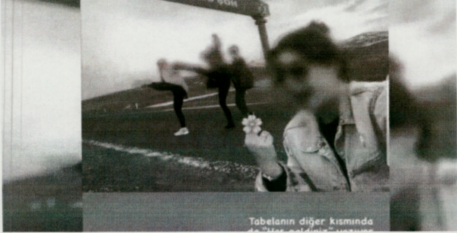
Tabelanın diğer kısmında da "Her geldiniz" yazıyor